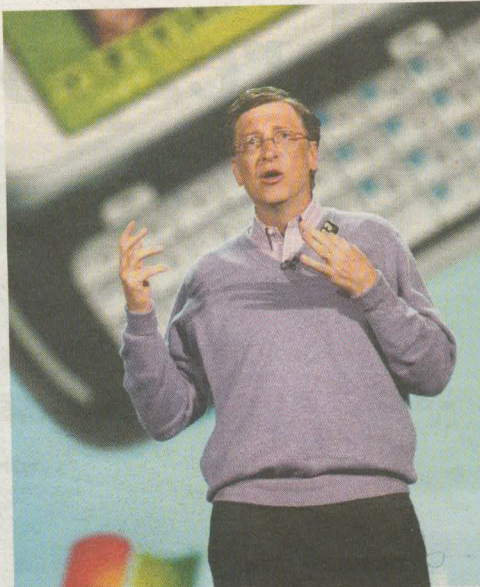
Prvi mož Microsofta Bill Gates pravi, da je delitev oglaševalskega prostora krivična do uporabnikov.

Sestanki za zaprtimi vrati potekajo tudi med Yahoojem in še enim splet-